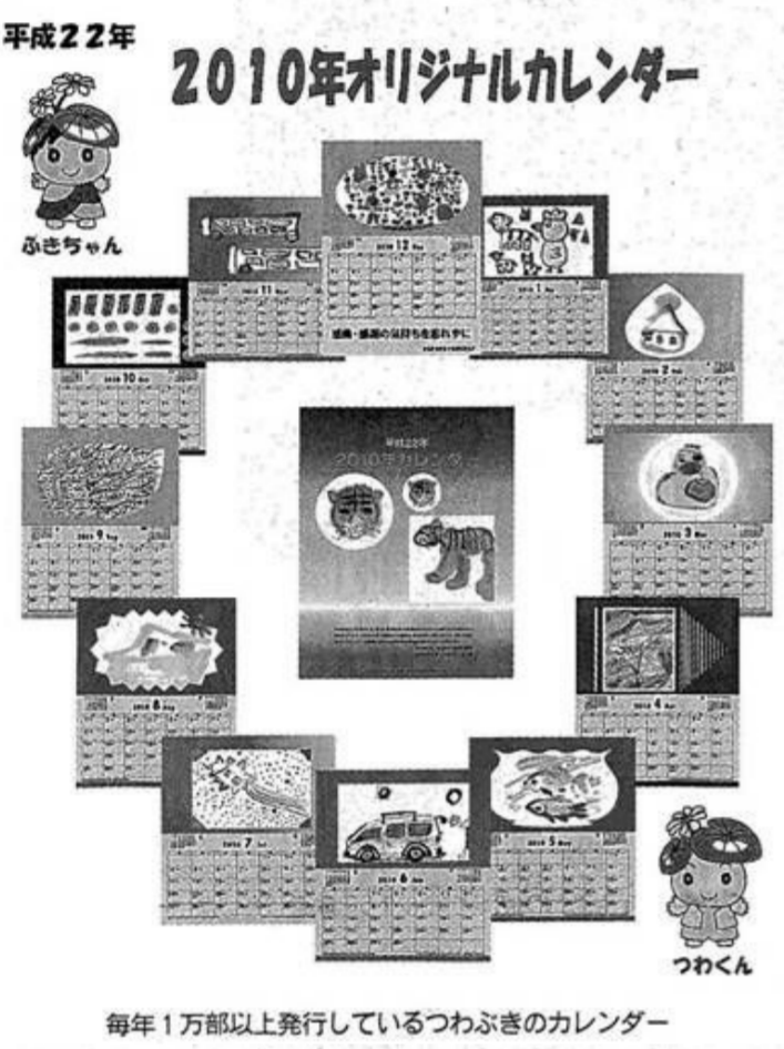
平成22年 2010年オリジナルカレンダー